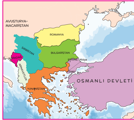
II. Balkan Savaşı sonrasında Balkanlar