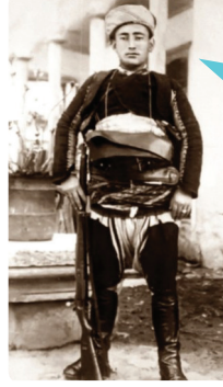
Yörük Ali Efe

Milli Mücadele kahramanlarından birisiyim. Aydın'da doğdum. Milli Mücadele'ye katıldığımda 23 yaşındaydım. Aydın bölgesinde ilk Kuvâ-yi Milliye birliğini oluşturarak işgale direndim. Kurtuluş Savaşı'nda düzenli orduya katıldım. Yunan kuvvetleri ile kahramanca çarpıştım. Bölgede çok sayıda vatansızın Milli Mücadele'ye destek vermesini sağladım.