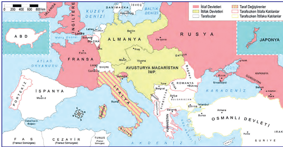
I. Dünya Savaşı'nda taraflar.